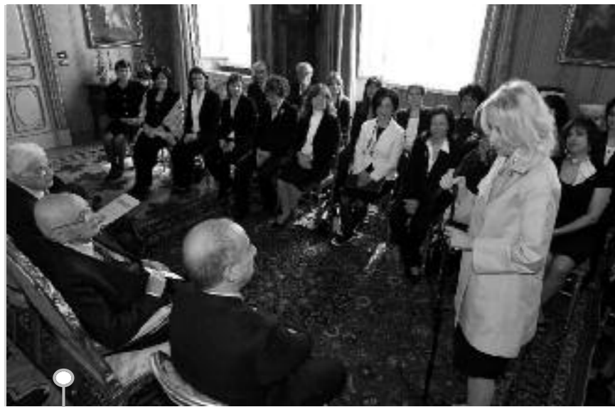
La delegazione della mostra ricevuta dal Presidente Napolitano

verso iniziative di collaborazione tra mondo della ricerca pubblica e impresa privata, per condividere comuni obiettivi di diffusione della cultura scientifica.