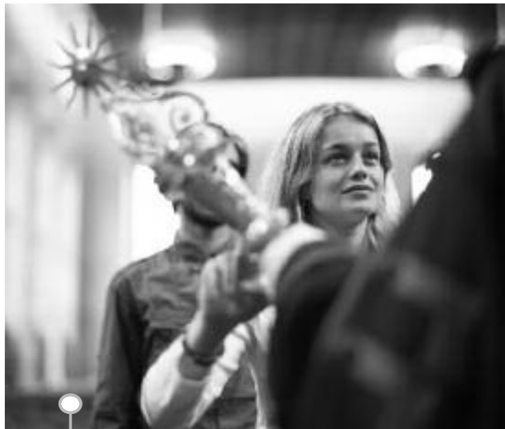
Università Carolina di Praga: un momento della cerimonia di laurea

Nel 2001 il Presidente Ciampi l'ha insignita della carica di senatrice a vita. Tutti ricordiamo l'inflessibile impegno con cui questa minuta signora di ferro ha compiuto il suo dovere in Parlamento, senza curarsi dei commenti malevoli che ha affrontato con elegante fierezza. Rita Levi Montalcini vorrebbe lasciare ai giovani una sorta di testamento spirituale: «Il male assoluto del nostro tempo è di non credere nei valori».